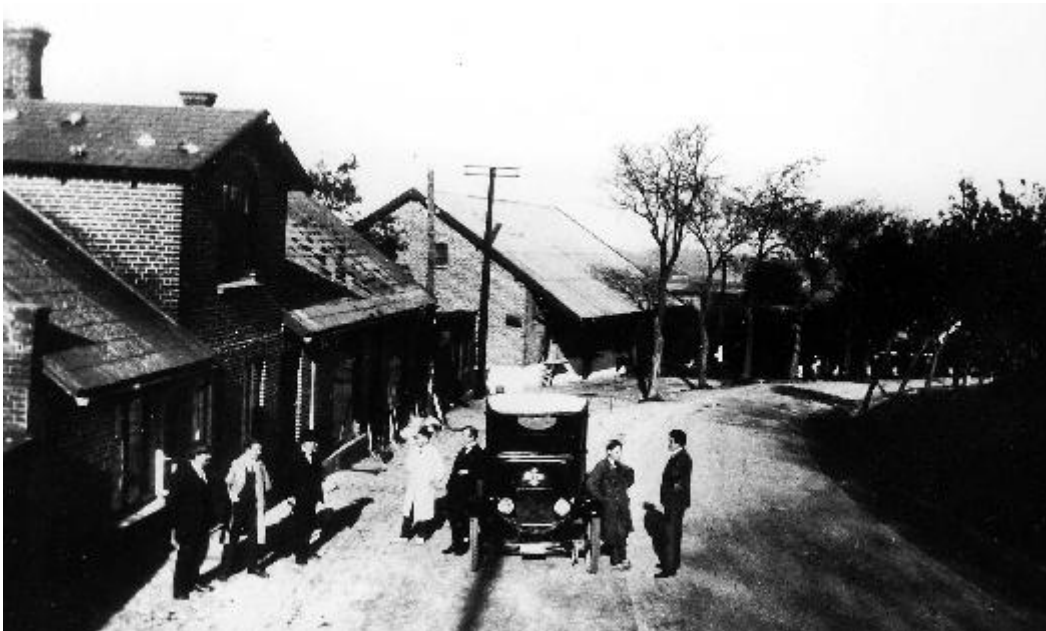
Skaade Forbrugsforening var ofte samlingssted for den almindelige snak - indendørs, eller som her på billedet lige udenfor. Bemærk Hads Herredsvejen (Oddervej), som dengang gik helt tæt på brugsforeningen og foderstoffabrikken "Møllen". Først senere blev Oddervej rettet ud i det vejforløb, vi kender i dag.